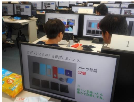
先生から、プロジェクターの部品について説明されています。