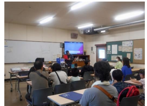
VR 溶接体験をとおして、溶接の面白さを知っていただきました。