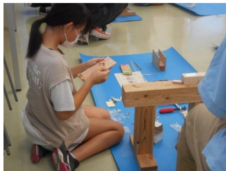
時計の針を上手にはめることができたかな？