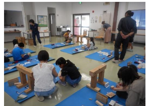
ご家族の方と一緒に協力して、時計制作に取り組んでおられました！