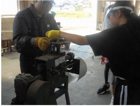
先生と一緒にきれいな溝を作ってみよう！