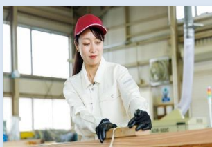
手工具・電動工具の使い方