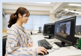
立体モデルの作成とプレゼン