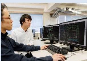
パソコンを使った図面作成