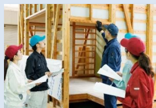
木造住宅の外装内装工事