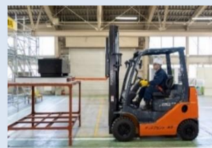
フォークリフトの運転技能講習