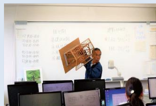
住宅の構造や法律など