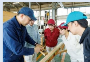
材料の知識と部材の加工