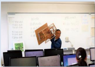
住宅の構造や法律など