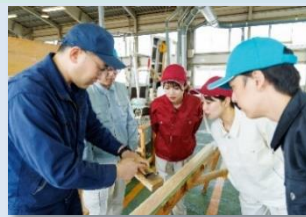
材料の知識と部材の加工