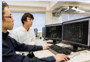
パソコンを使った図面作成