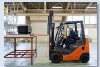
フォークリフトの運転技能講習