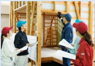
木造住宅の外装内装工事