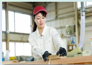
手工具・電動工具の使い方