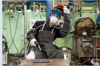
ガス溶接・炭酸ガスアーク溶接