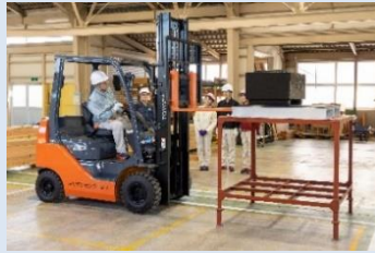
フォークリフト運転作業