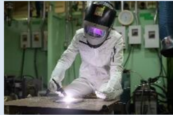
TIG (ティグ) 溶接