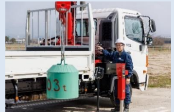
クレーン・玉掛け作業