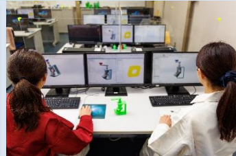
3次元モデル作成作業