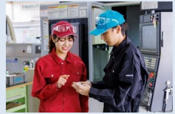
マシニングセンタ作業