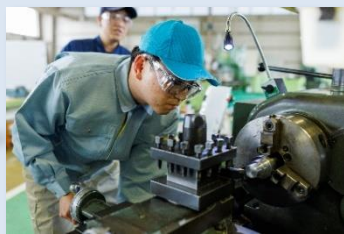
旋盤及びフライス盤作業