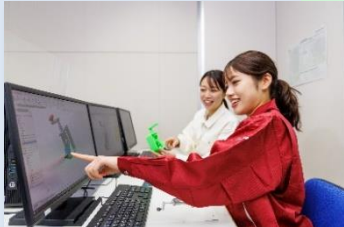
機械製図及びCAD基本