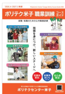
「職業訓練コースガイド」