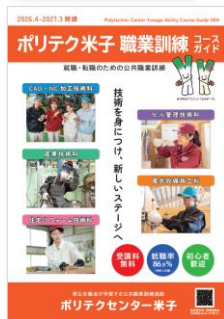
「職業訓練コースガイド」