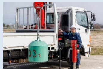
クレーン・玉掛け作業