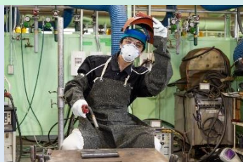
ガス溶接・炭酸ガスアーク溶接