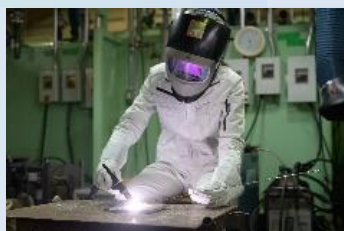
TIG (ティグ) 溶接