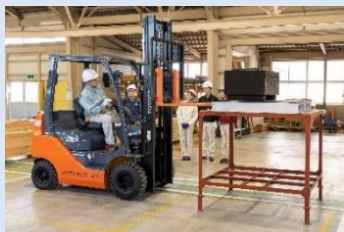
フォークリフト運転作業