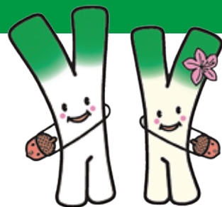
米子市のマスコット「ヨネギズ」