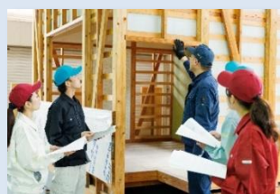
木造住宅の外装内装工事