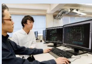
パソコンを使った図面作成