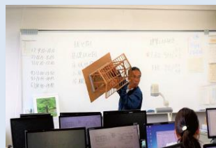
住宅の構造や法律など