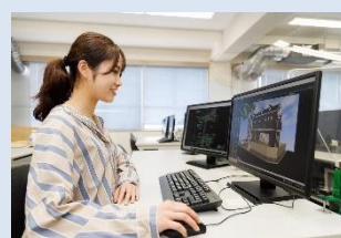
立体モデルの作成とプレゼン