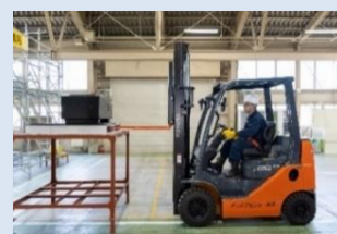
フォークリフトの運転技能講習