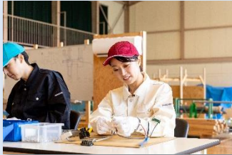
電気工事単位作業