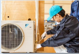
エアコン (空調設備)