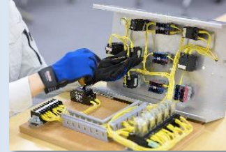
ビル設備の電気制御