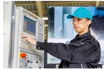
パソコンで設計したデータを、材料に合わせた専用の機械で製造します