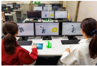
「CAD」というパソコンソフトを使って部品を設計します