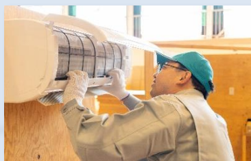
エアコン(空調設備)工事