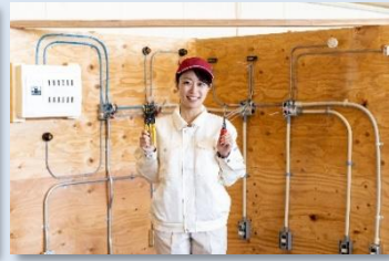
現場を想定した配線工事