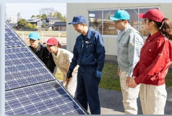
太陽光パネルなどの設備工事