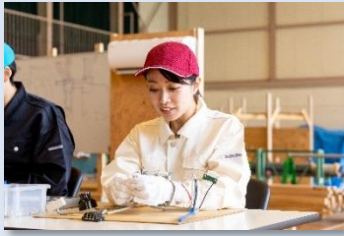
電気の知識と工事の基本