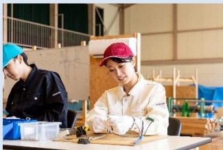
電気工事単位作業