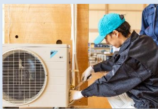
エアコン (空調設備)