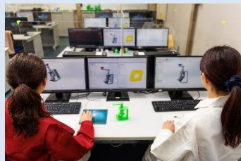
3次元モデル作成作業