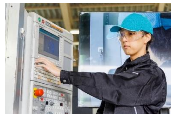
パソコンで設計したデータを、材料に合わせた専用の機械で製造します