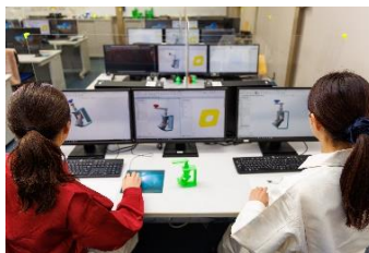
「CAD」というパソコンソフトを使って部品を設計します