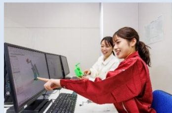
機械製図及びCAD基本