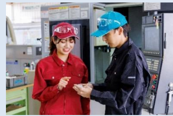
マシニングセンタ作業