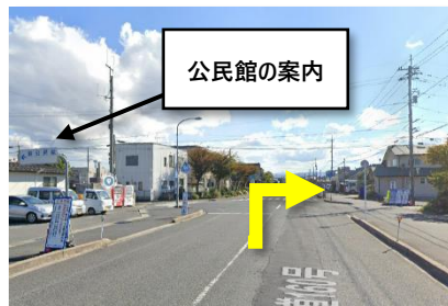
① 駅出口からそのまま3分位歩くと左側に「巖（いわお）公民館」の案内と自動販売機が見えるので、その先の交差点を右折する