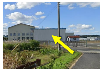
⑤ 7分位歩くとポリテクセンターの裏門に到着するので、そのままお進みください