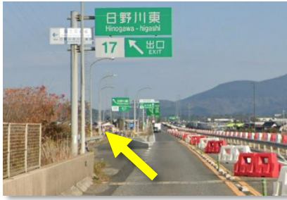
① 日野川を渡るとすぐに「日野川東IC」の出口があるので、出口から側道に入る