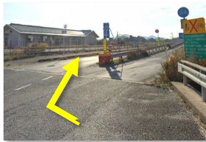
④ 右折後は奥の側道へ進む ※ 手前側に進むと山陰道に戻ってしまいます