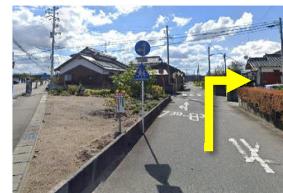
④ 内科の横の道に入ったすぐの交差点を右折する