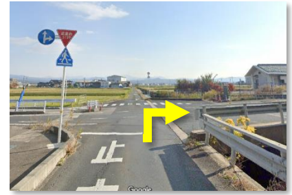
③ 山陰道をくぐってすぐの一時停止を右折する ※ 左側からの車に十分ご注意ください