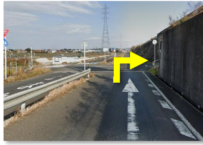
② 側道を降りてすぐの交差点を右折する