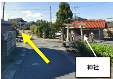
② 7分位歩くと、右側に神社が見えるので、そのまま直進して信号がある交差点まで進む