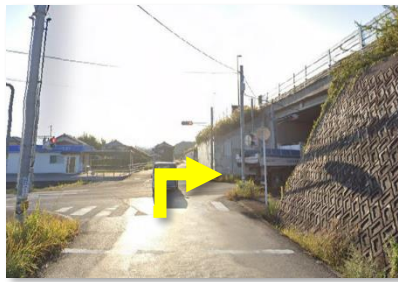
⑤ 1つ目の信号を右折する