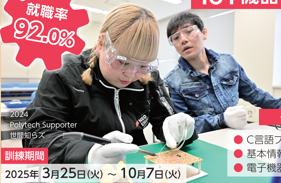
2024 Polytech Supporter 世間知らず