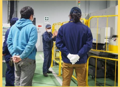
「TIG溶接、曲げ加工による貯金箱製作」

すごく分かりやすく説明しながら、教えてくれたのでスムーズに頭に入ってきてとてもよかったです。(20代・男性)