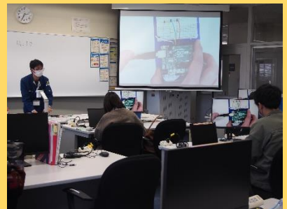
「マイコンプログラム実習」

IoT実習においてハードと組込みソフトが中心でした。ネットワーク機器との関連も知りたい。(50代・男性)