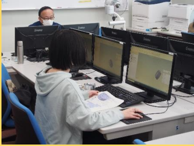
「CAMを用いたアルミ時計製作」

担当指導員の方がきめ細やかに教えてくださったので、全く知識がない私でも楽しめました。(20代・女性)