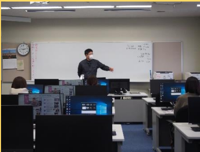
「家の立体シミュレーション」

実際に、家具の配置をする時間が多く設けられていて、おもしろかったです。(20代・女性)