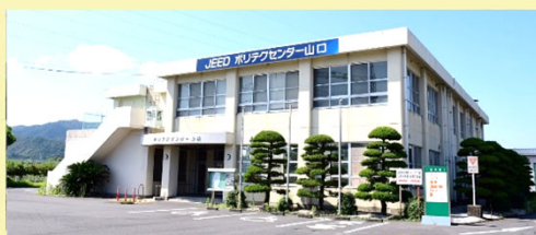
ポリテクセンター山口