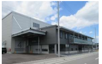
▲内山電機工業株式会社 社屋