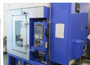
▲ツールチェンジ式CNC高圧洗浄機