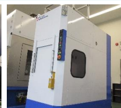
▲狙いシャワー洗浄機