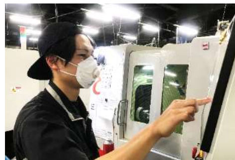
N Cオペレーション科 (企業実習付きコース)

工具研削盤を用いた切削工具の加工、プログラムの作成を行っています。図面をもとに数値を入力し、思い通りの形になったときにやりがいを感じます。