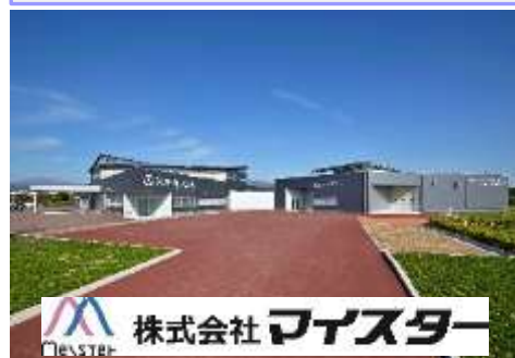
株式会社 マイスター

採用にあたっては、素直・前向き・明るい・挨拶を重視しており、社会人としてきちんと仕事を進めてくださる方を求めています。即戦力でなくとも、ポリテクで基礎を習得することを期待しています。