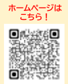
ホームページはこちら!