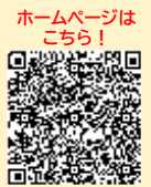
ホームページはこちら!