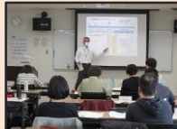
キャリアガイダンス