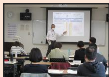
キャリアガイダンス