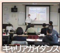
キャリアガイダンス