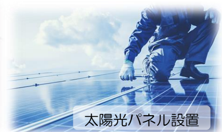
太陽光パネル設置