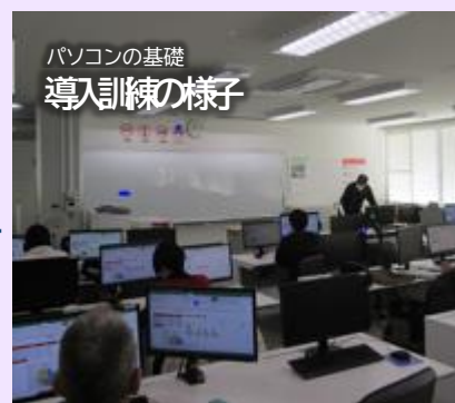
パソコンの基礎 導入訓練の様子