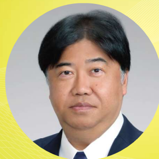
東京大学大学院 工学系研究科 マテリアル工学専攻 特任教授