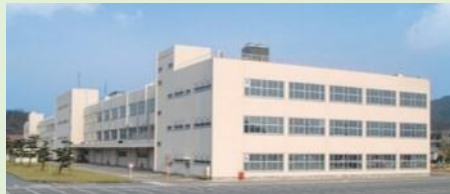
三洋テクノソリューションズ鳥取（株）

今後の予定としては、2～3年後くらいの時点で次のステップの研修を検討したいと思います。