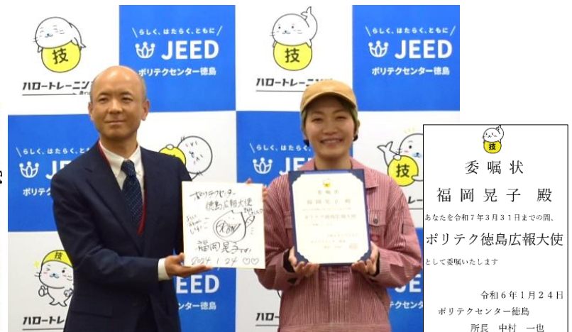
（左）ポリテク徳島所長 （右）アッコビン

ポリテクセンター徳島は、職業訓練の認知度向上を目的とした広報活動の一環として、徳島県出身で現在「アッコビン」として活動されている福岡晃子さん（元チャットモンチー）を「ポリテク徳島広報大使」に委嘱し、令和6年1月24日に就任式を開催しました（任期は令和7年3月末まで）。