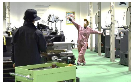
（左）徳島といえば花環ですよ （中央）就任式の様子 （右）撮影快調！