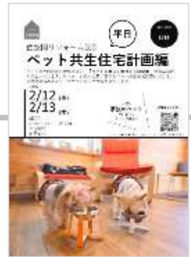
2/12(水)、13(木) ペット共生住宅計画編