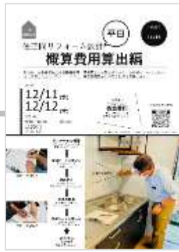
12/11(水)、12(木) 概算費用算出編