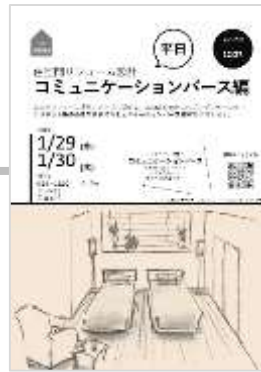
1/29(水)、30(木) コミュニケーション パス編