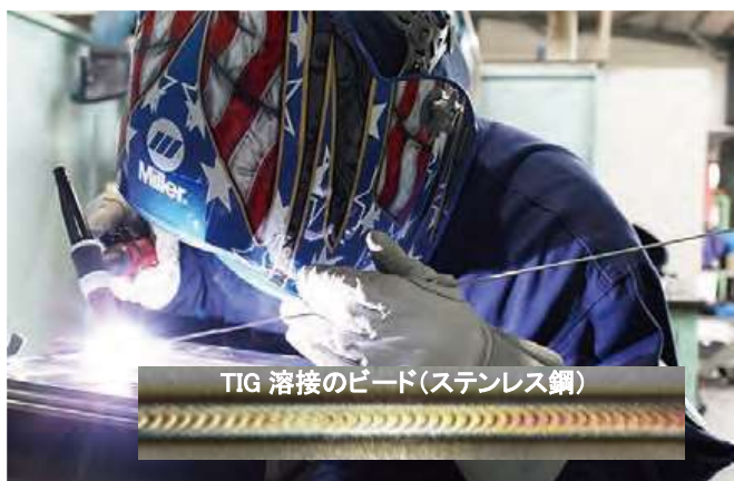
TIG 溶接のビード(ステンレス鋼)

アーク溶接 とは空気のような気体に電気を流す、放電現象を利用して金属を溶かして接合するものです。 「被覆アーク溶接」 、「 半自動溶接 」、「 TIG溶接 」など様々な種類・方法があります。