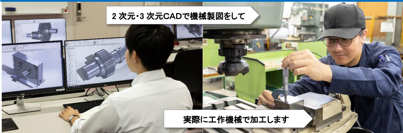
2次元・3次元CADで機械製図をして