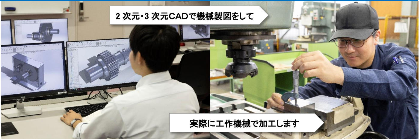
2次元・3次元CADで機械製図をして