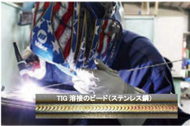
TIG 溶接のビード(ステンレス鋼)

アーク溶接 とは空気のような気体に電気を流す、放電現象を利用して金属を溶かして接合するものです。