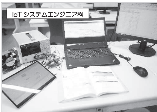
IoTシステムエンジニア科