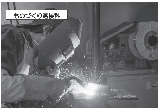
ものづくり溶接科