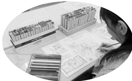
インテリア提案・プレゼンテーション実習 <住環境コーディネート科>