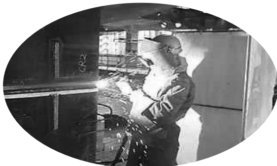
炭酸ガス半自動アーク溶接実習 <ものづくり溶接科>

●11月から企業実習を予定している8月入所1月修了者も掲載しました。 ものづくり機械加工科(企業実習付き)