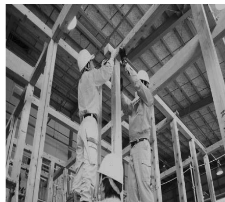
建て方実習<リノベーションデザイン科>