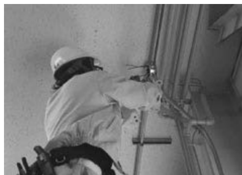
住宅設備施工実習<電気設備施工科> ※1月11日~2月7日企業実習予定