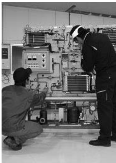
空調設備保全管理実習 <ビル設備サービス科>