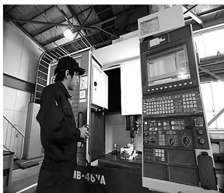
工作機械実習 <CAD・NC加工科>