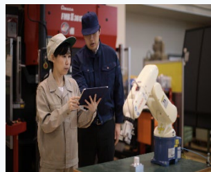
▲ 小型ロボットアームの制御実習