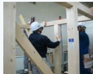
▲ 木造軸組工法による建物組立の実習

「ハロートレーニング-急がば学べ-」とは、新たなスキルアップにチャレンジするすべてのみなさんをサポートする公的職業訓練の愛称とキャッチフレーズです。