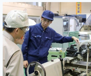
▲ 難削材の切削加工実習