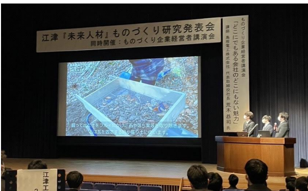
図 22 江津“未来人材”ものづくり研究発表会の様子

そこでの発表は、取り組みを発表するだけでなく島の星山の活動に共感されることを目的に学生を指導して臨んだ。発表後、講評された建設関係者や江津市建設業協会から、今後の活動に対して積極的に協力していただくことになる。