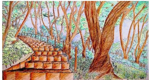
図 4 瓦の登山道計画(手書きパース)

登山道には、江津市特産の石州瓦を主に使用することにした。製造において欠陥品となった瓦を再利用し、それと山にある石や土、水を使って製作することにした。コストの削減、持続可能な取り組みで自然素材の活用として GX にもつながる計画である (図 4)。この計画が、2022 年度の登山道整備に活かされることとなる。