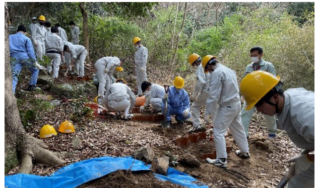
図 23 江津工業高校との合同作業の様子

当日は、3名1グループを形成し、4グループ毎に当校の学生やボランティア、高校の教員についてもらい作業を行った。およそ4時間の作業で約50段の登山道が整備された(図23)。