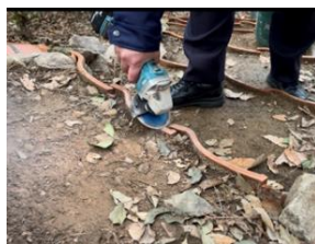
図 18 滑り止め