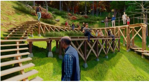
図7 3Dによる休憩スペース