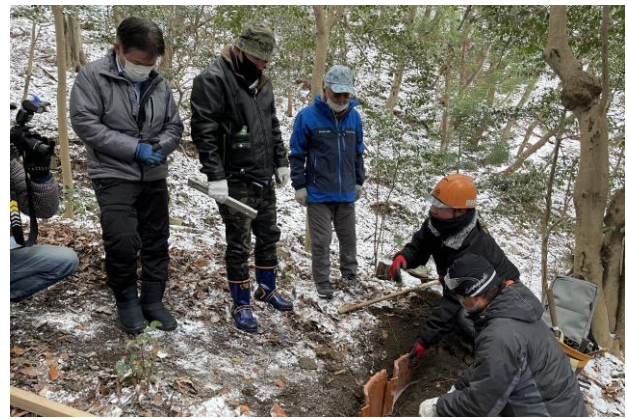
図 20 講習会の様子

講習会では、一般の方とは別に建設業協会に協力をお願いし、専門性の高い方にも参加していただいた。SNS や新聞の記事を見た、遠方より参加された方もいた。総勢 15 名の参加があり、午前中の短い時間でしたが、これまでに培ってきた施工方法を伝えることが出来た。また、グラインダーで上部を削り滑り止めにする作業は、この講習会の意見により追加された作業である。