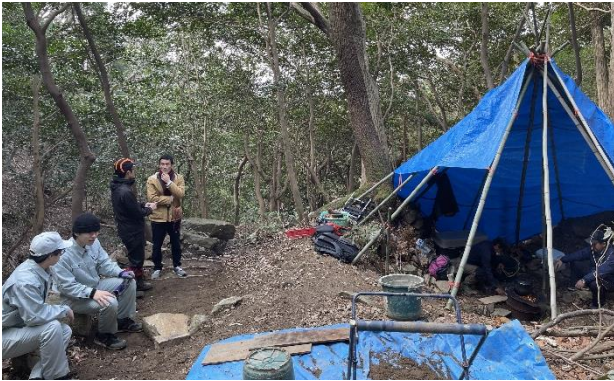
図 21 休憩スペースの様子