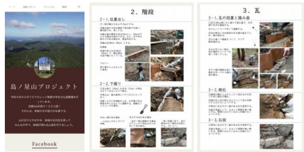
図 19 トップページ及び施工マニュアル

ウェブページには、今までの活動をブログや SNS で確認できる他、施工方法のマニュアルを確認することが出来る。施工マニュアルは、前項の登山道製作をまとめたものであり、動画マニュアルも作成し、動画でもわかるようにしている。特に SNS では、ボランティアを増やすため機運の醸成にもつながる。