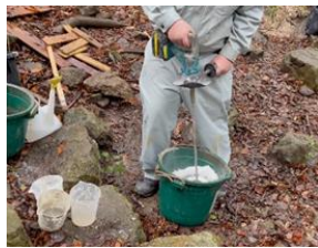
図 16 かくはん機