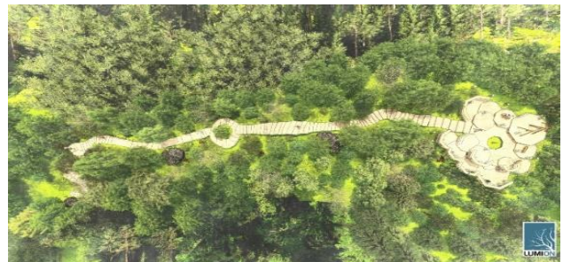
図 5 頂上の計画

計画では、BIM を使用し、デッキを使用した登山道や頂上テラスなど夢のある計画を提案した (図 5)。