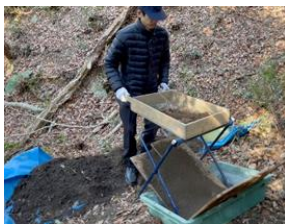
図 15 フルイ器

雨天時、瓦の上部がぬれると滑りやすくなることが判明した。そこで、グラインダーで上部を削ることで滑り止めとした (図 18)。