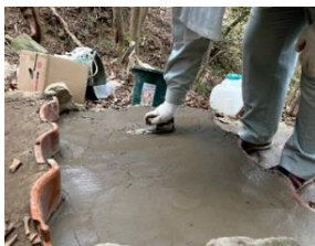
図 17 踏面