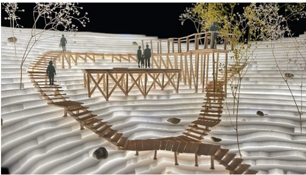
図8 模型による休憩スペース