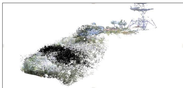
図 3 頂上付近点群データ

データ変換の仕様等を検証し、点群データをメッシュデータに変換、BIMにより頂上までの約 100m の登山道の計画を製作した。