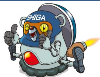
滋賀職能大オリジナルマスコット「しがポン」

経済的に困難な状況にある学生にも職業に必要な技能・技術を習得する機会の拡充を図ることを目的として認定要件を満たすことで 入校料及び授業料の全額、2/3、1/3、のいずれか減免が適用 される制度です。