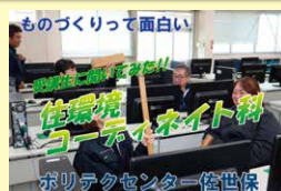
住環境コーディネイト科 受講生に聞いてみた!