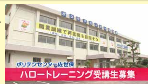
ポリテクセンター 佐世保訓練紹介