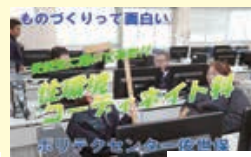
住環境コーディネイト科 受講生に聞いてみた