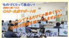
CAD・生産サポート科 受講生に聞いてみた