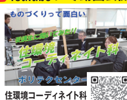
住環境コーディネイト科 受講生に聞いてみた