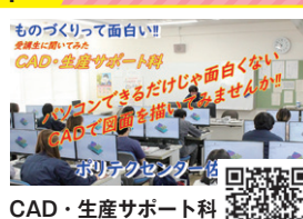
CAD・生産サポート科 受講生に聞いてみた