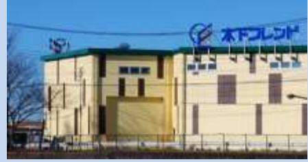
株式会社木下フレンド

2日目となる生産性向上支援訓練【成果を上げる業務改善】をどのように深堀できるか、という視点で訓練内容を固める方向で受講企業と相談。運営方針に基づき各事業部門で幾つかの具体的な課題を抽出し、課題を明確化し原因分析を行い課題解決の道筋をつける手法を学ぶ方向とした。