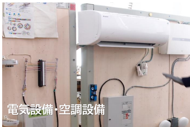
電気設備・空調設備