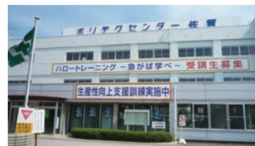
JR長崎本線伊賀屋駅前より徒歩1分