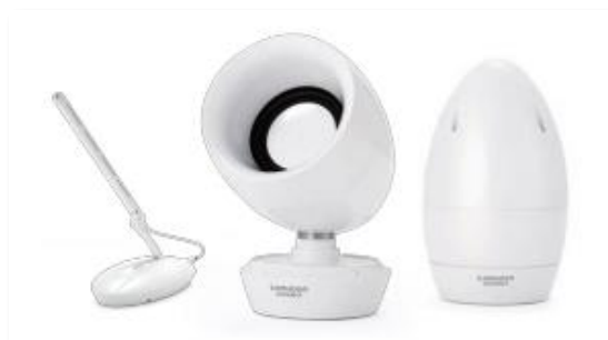
聴こえ支援スピーカー-comuoon (JIS1-1)