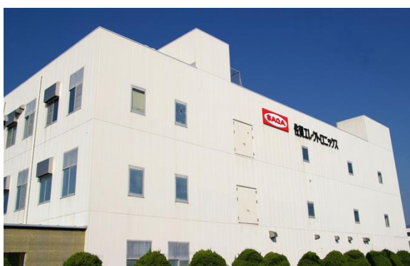
(佐賀エレクトロニクス株式会社 工場棟)

当社が長年培ってきた製造技術、品質管理によって造り上げた製品は、自動車、産業機械をはじめ、通信機器メーカーなど多くのお客様に採用いただいています。